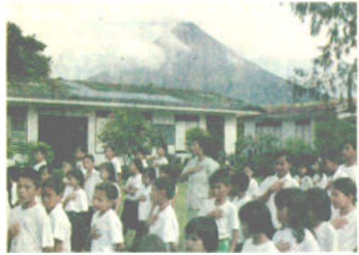
6月26日，菲律宾马荣火山附近一所学校的小学生在唱国歌。图中远处的马荣火山口仍然冒着浓烟。马荣火山于23日再度喷发，目前比较平静。