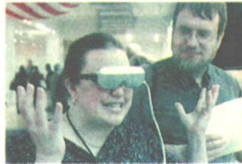
6月25日，纽约电脑大展开幕。一位观众在试用奥林巴斯公司出产的眼镜式电脑时露出惊讶之色。这幅“眼镜”配有高清晰度宽屏幕，可观看DVD与其它电脑信息。